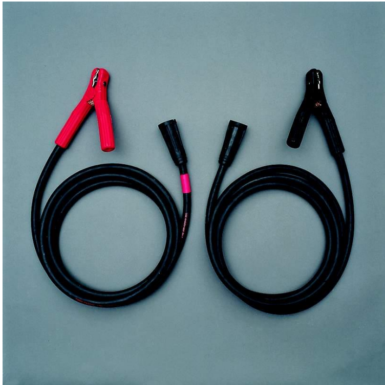
GA - 00554 kábelkészlet